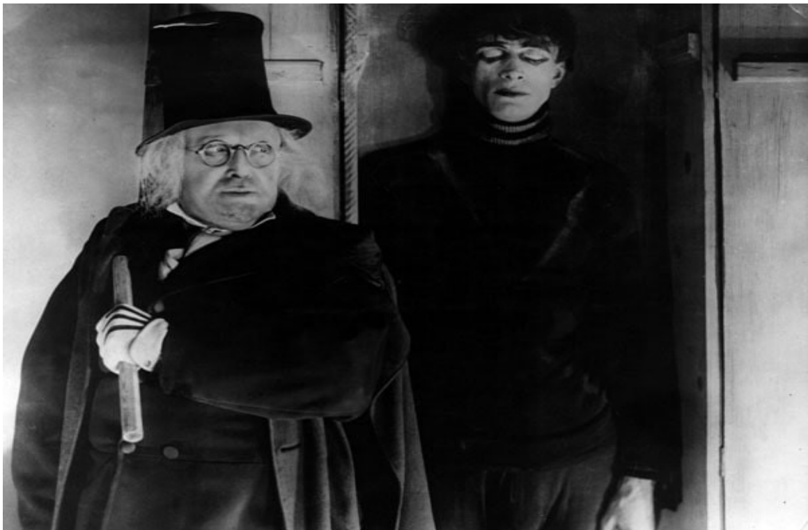
Il Gabinetto del dott. Caligari (1920) - Robert Wiene