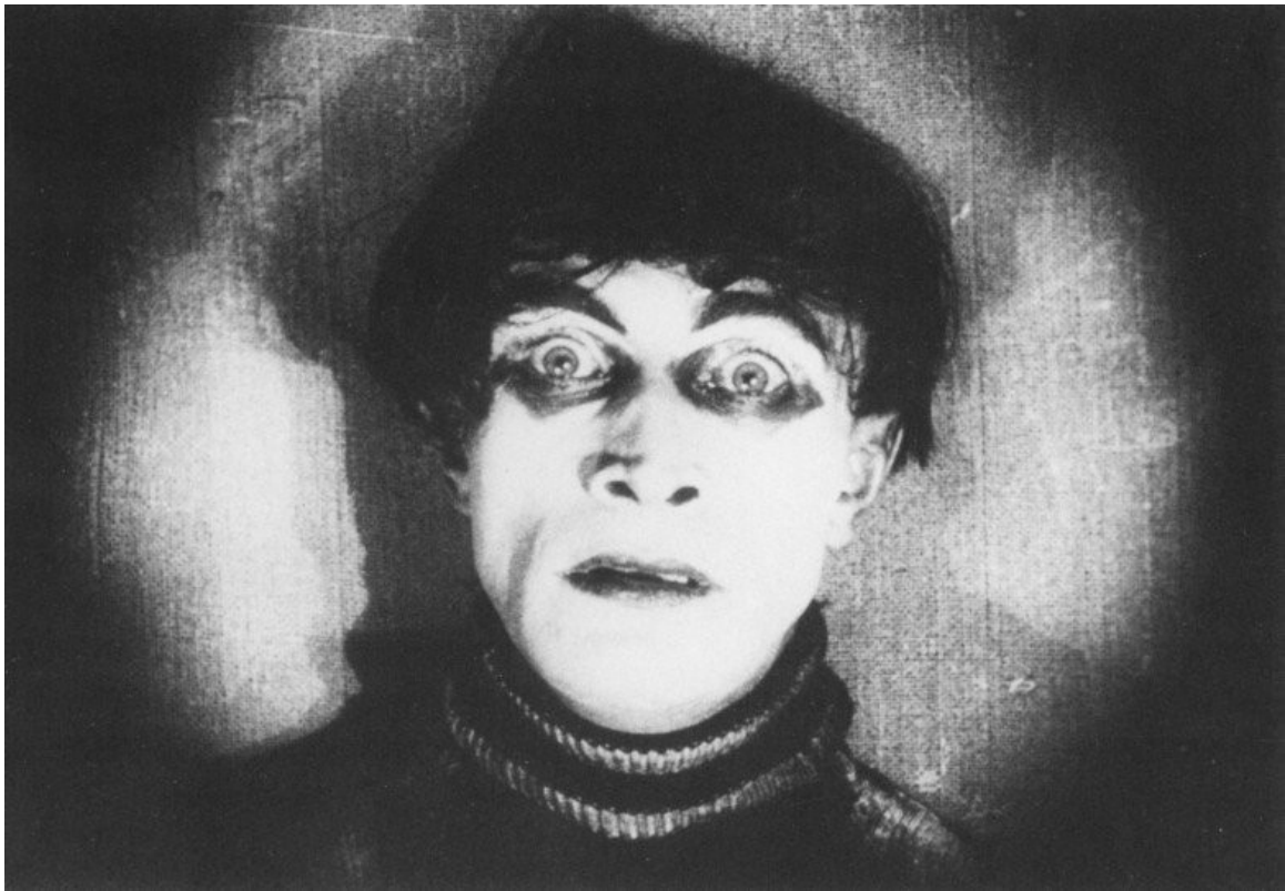
"Cesare" ne Il gabinetto del dott. Caligari (1921) – R.Wiene