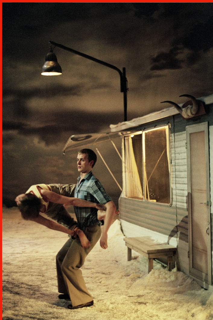
Peeping Tom, 32, Rue Vandenbranden

Anche le luci, svolgendosi la vicenda dal tramonto all'alba, giocheranno un ruolo chiave per rendere l'atmosfera di questo altrove . Oltre a voler restituire l'idea del trascorrere del tempo attraverso il ciclo della luce naturale, abbiamo pensato a delle piccole fonti di luce, un fuoco, o dei giochi di ombre sulla tenda, per dare corpo alle paure e ai fantasmi che attraversano insieme ai personaggi questa lunga simbolica notte, fino al sorgere del sole.