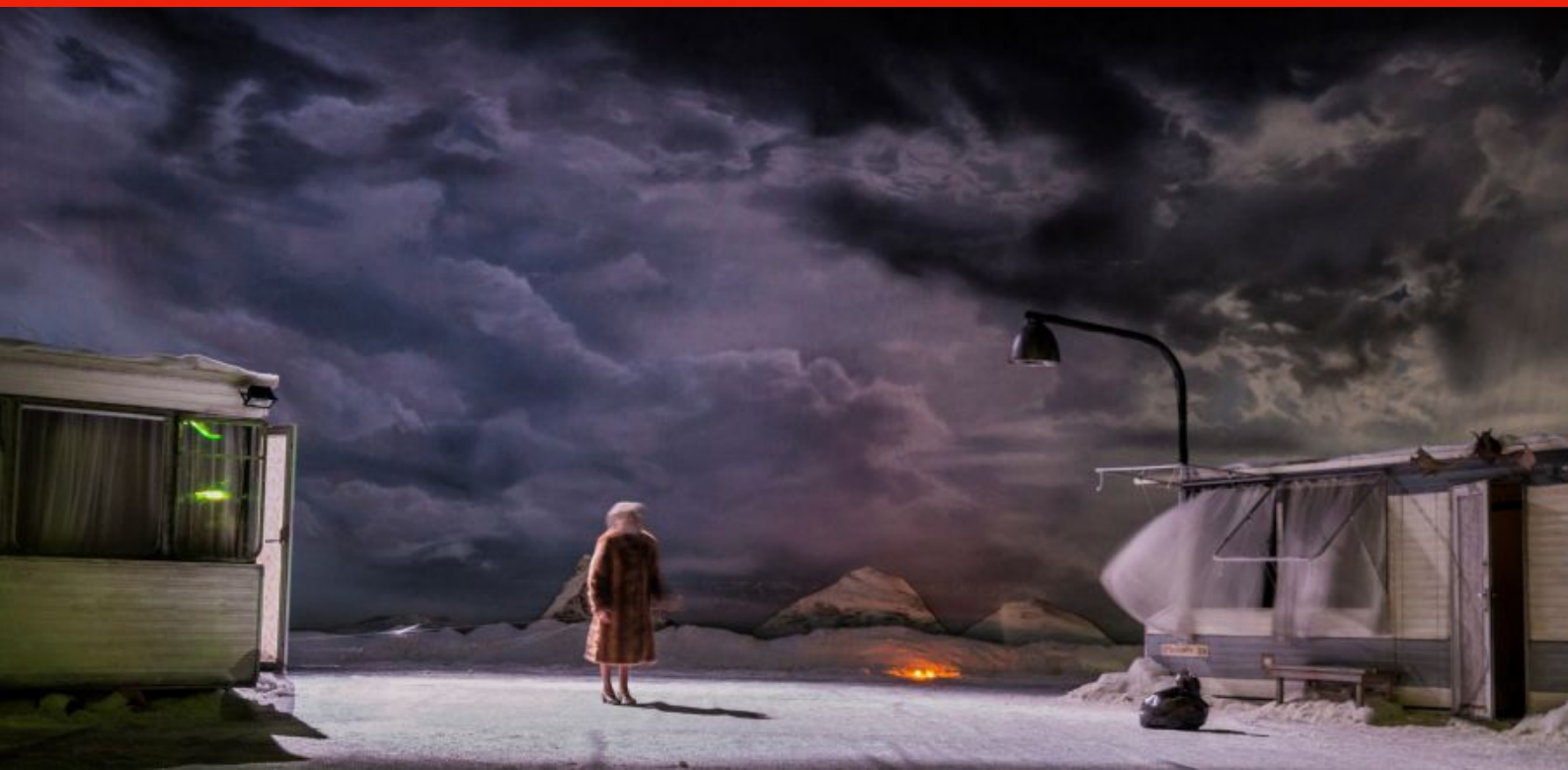
Peeping Tom, 32, Rue Vandenbranden