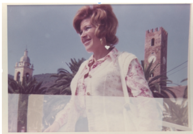
Petunia in viaggio (fotografia d'archivio)

Una coincidenza per noi fortunata e, citando Virginie Despentes in King Kong Théorie , « la metafora di una sessualità che oltrepassa i generi politicamente imposti dalla fine del XIX secolo. King Kong è oltre la femminilità e la virilità; egli è a metà tra uomo e animale, tra adulto e bambino, buono e cattivo, primitivo e civilizzato. Ibrido, oltre l'obbligo del binario di genere. »