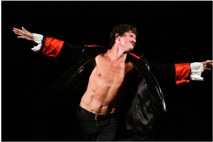
FOTO DI SCENA